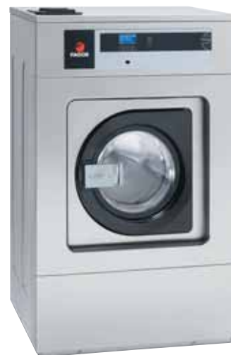
LA-18 MP E