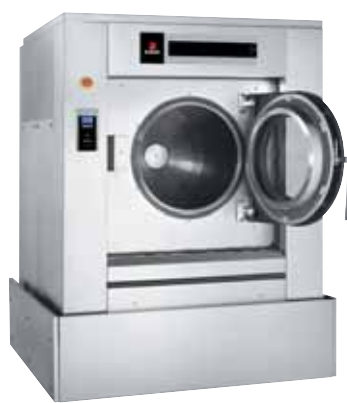
Svislá poloha: praní