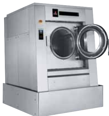
Vyklopení VZAD: vkládání prádla