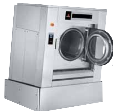
Vyklopení VPŘED: vyjímání prádla