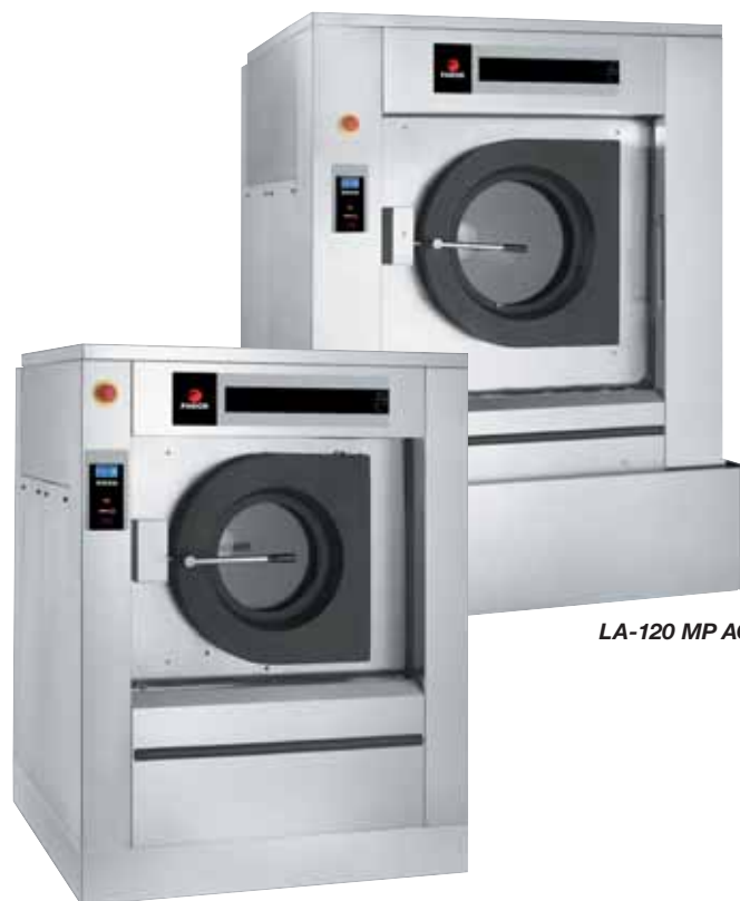
LA-120 MP AC